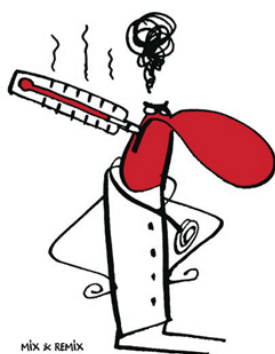
Le Médecin et la Colère